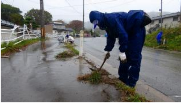
宮城県石巻市 牡鹿半島（おしかはんとう）小湊浜（こぶちハマ）にて草刈り作業