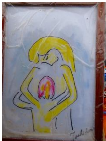
未だに見つからない子どもさんに 親からの手紙